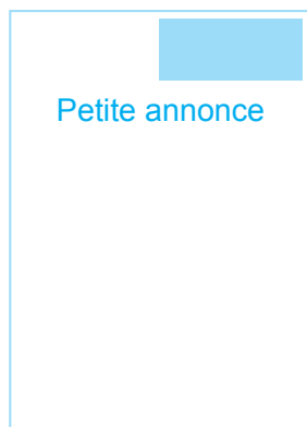
H 30 x L 60 mm